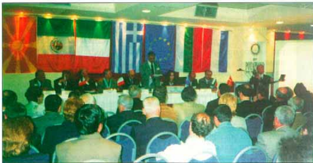
В заседателната зала